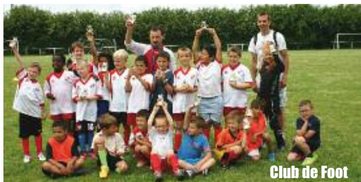
Club de Foot