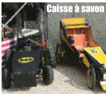
Caisse à savon