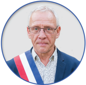
Thierry CAUSIN CONSEILLER MUNICIPAL DÉLÉGUÉ À LA CULTURE