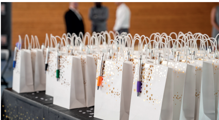
Cérémonie des diplômés