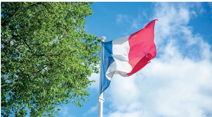
Commémoration du 08 mai