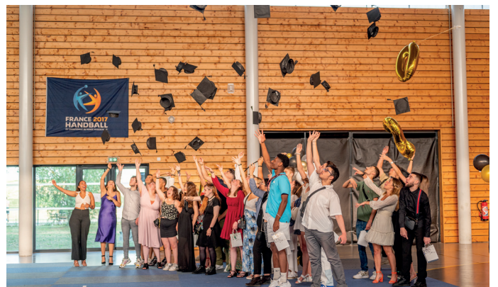
Cérémonie des diplômés