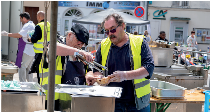
Brocante du Comité des fêtes