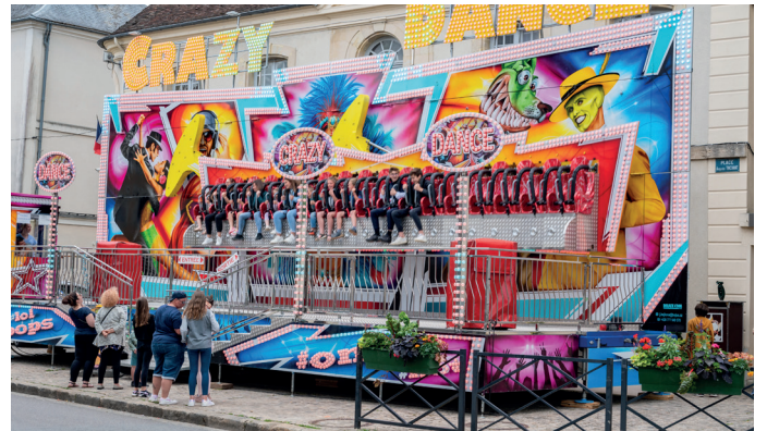
Fête foraine de Jouarre