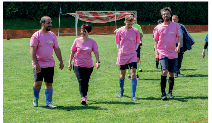
Tournoi de football inter-commerçants