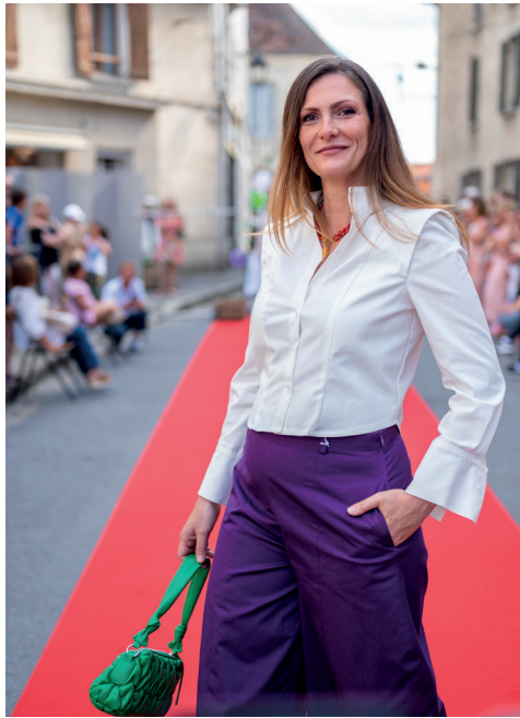
Défilé de mode de Petite Mains