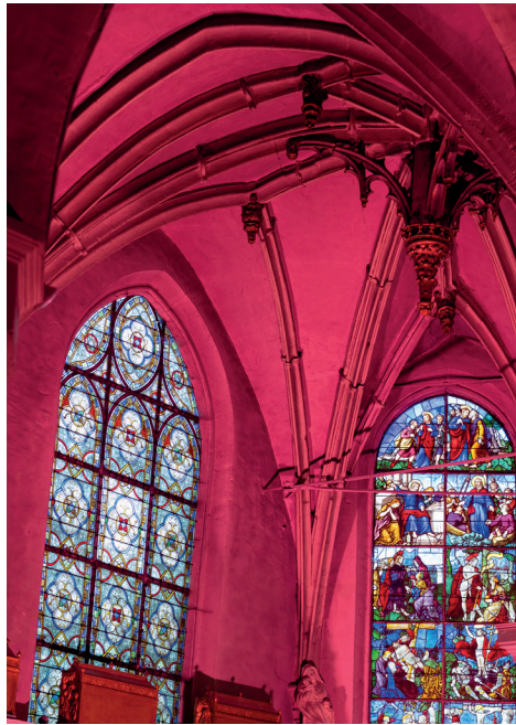
Concert de Nicoletta