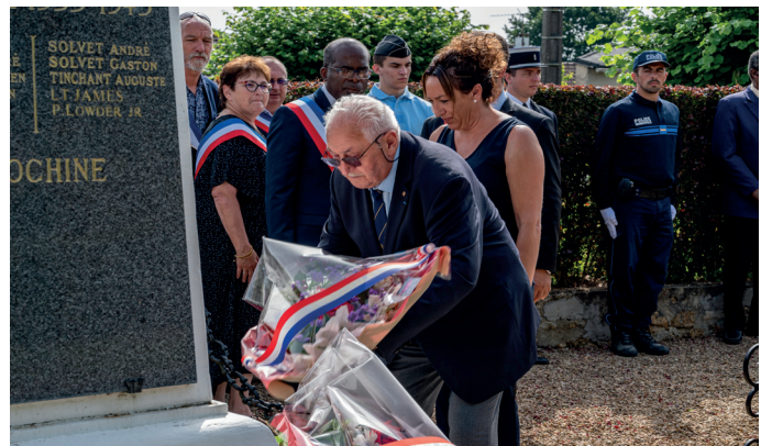
Commémoration du 18 juin