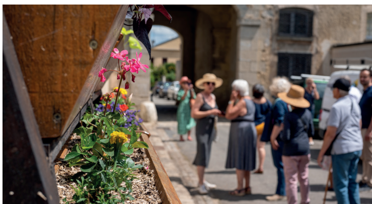
Visite des jardins ouverts