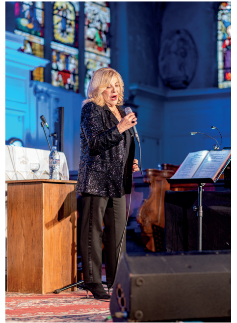
Concert de Nicoletta