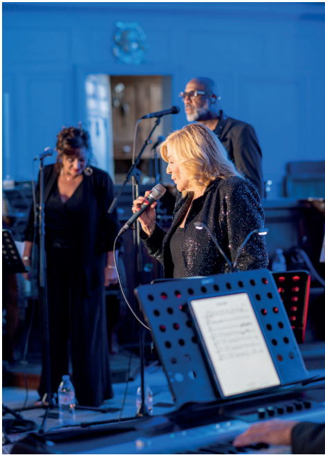
Concert de Nicoletta