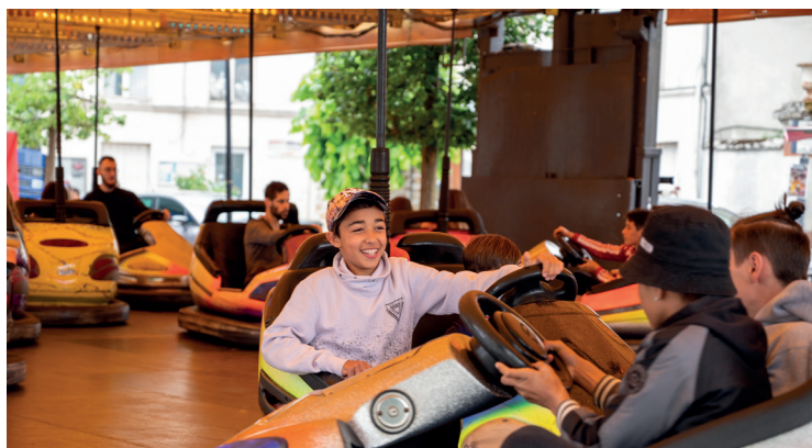
Fête foraine de Jouarre