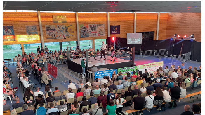
Gala de catch