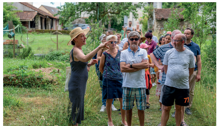
Visite des jardins ouverts