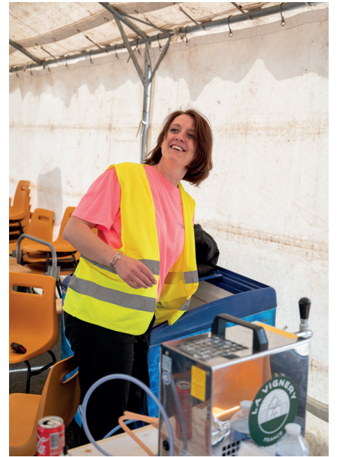
Brocante du Comité des fêtes